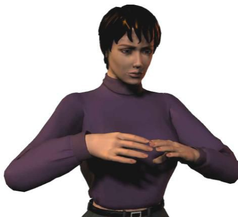
Optimale werkhouding voor knippen: tussen borst en schouderhoogte

De kapper verricht bij het werken aan de pompstoel de vaktechnische handelingen tussen borst en schouderhoogte met de schouders én ellebogen ontspannen laag hangend. Bij uitzondering mag de kapper hoger (tot ooghoogte) knippen.